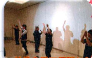
社員余興で優勝した ～Perfect Human～